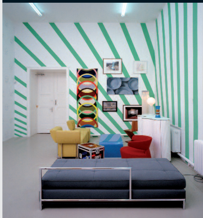
John Armleder. "Ne dites pas non!" (1986/2006)

Exposition de John Armleder – 18.05 - 28.09.08