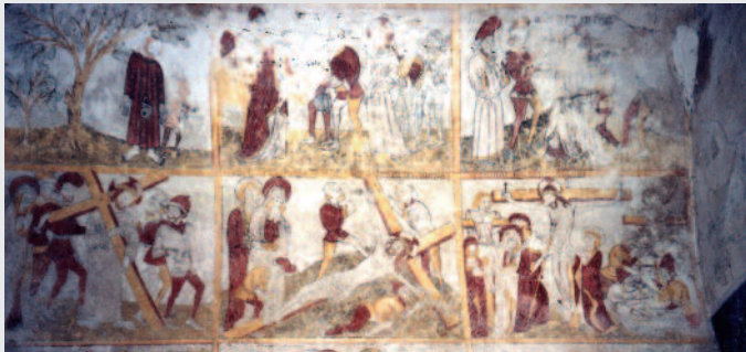
La Passion du Christ (extrait), église de Jenzat.