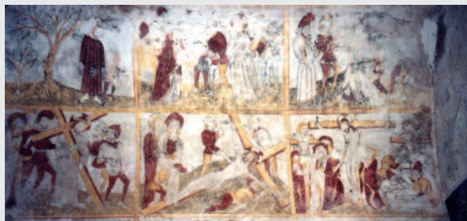
La Passion du Christ (extrait), église de Jenzat.